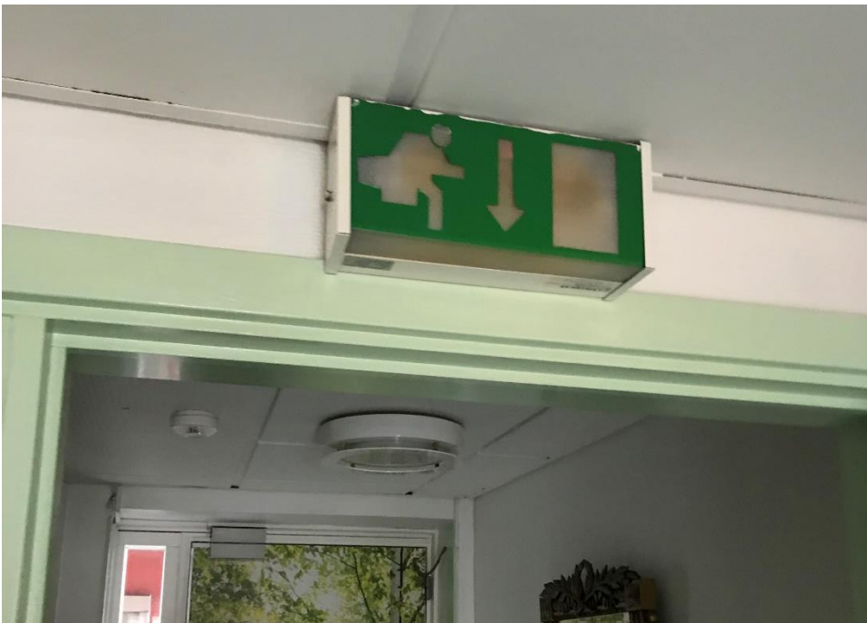
Figur 5: Mangelfuld sikkerhedsbelysning. Flugtvejsarmatur fungerer ikke. Der kunne ikke konstateres belysning af flugtvejsarealer på etagerne, på altangangen og på flugtvejstrapperne.