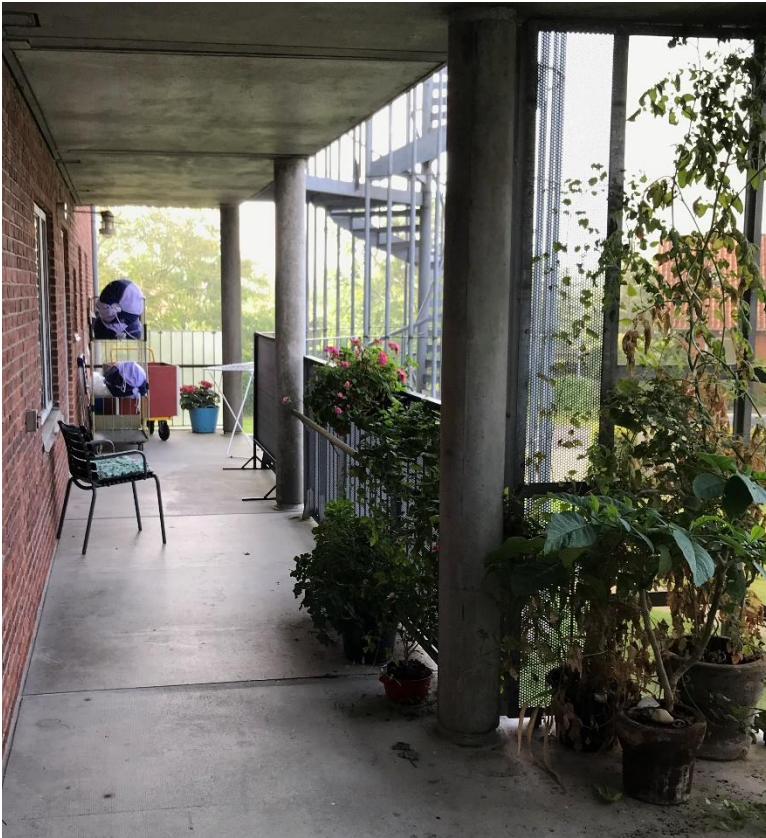
Figur 4: Manglende fribredde på 2.4 m, jf. BR82 pkt. 6.11.4 stk. 2. Brandbelastning i flugtvejsgange større end foreskrevet. (BR82 pkt. 6.5.1 stk. 3)