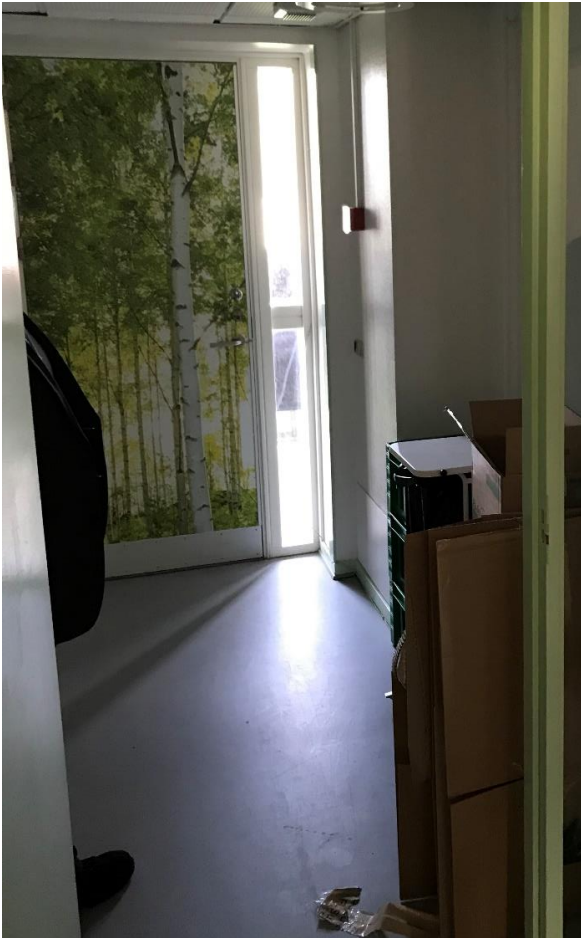
Figur 3: Manglende fribredde på 2.4 m, jf. BR82 pkt. 6.11.4 stk. 2. Samtidig er brandbelastning i flugtvejsgange større end foreskrevet. (BR82 pkt. 6.5.1 stk. 3)