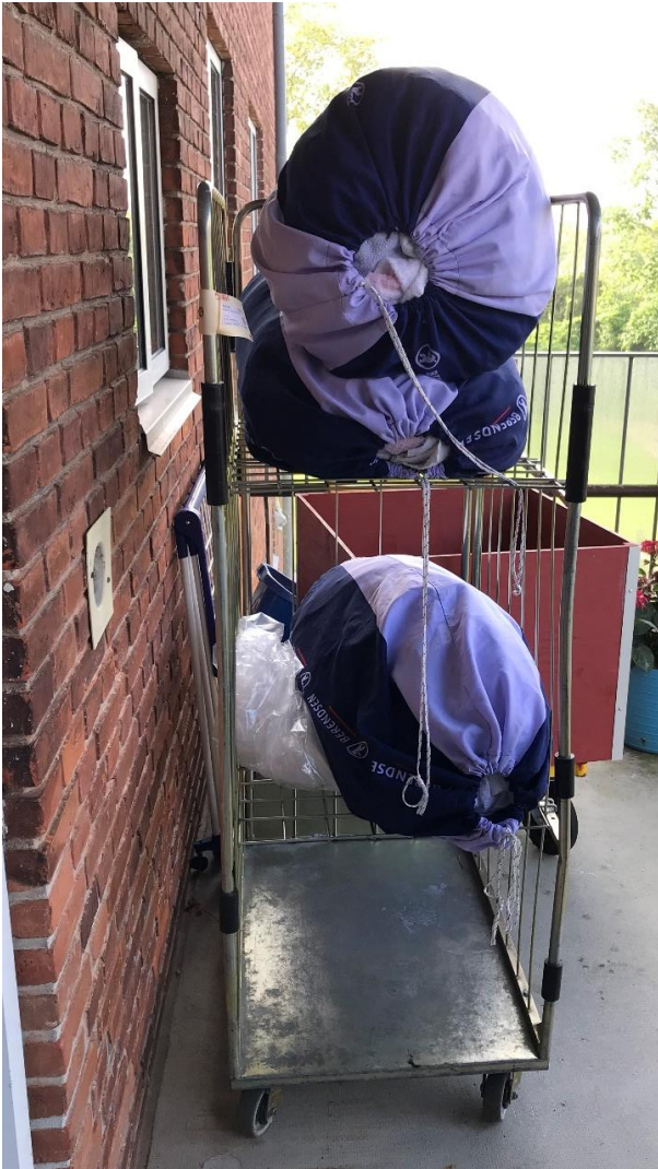
Figur 4: Brandbelastning i flugtvejsgange større end foreskrevet. (BR82 pkt. 6.5.1 stk. 3)