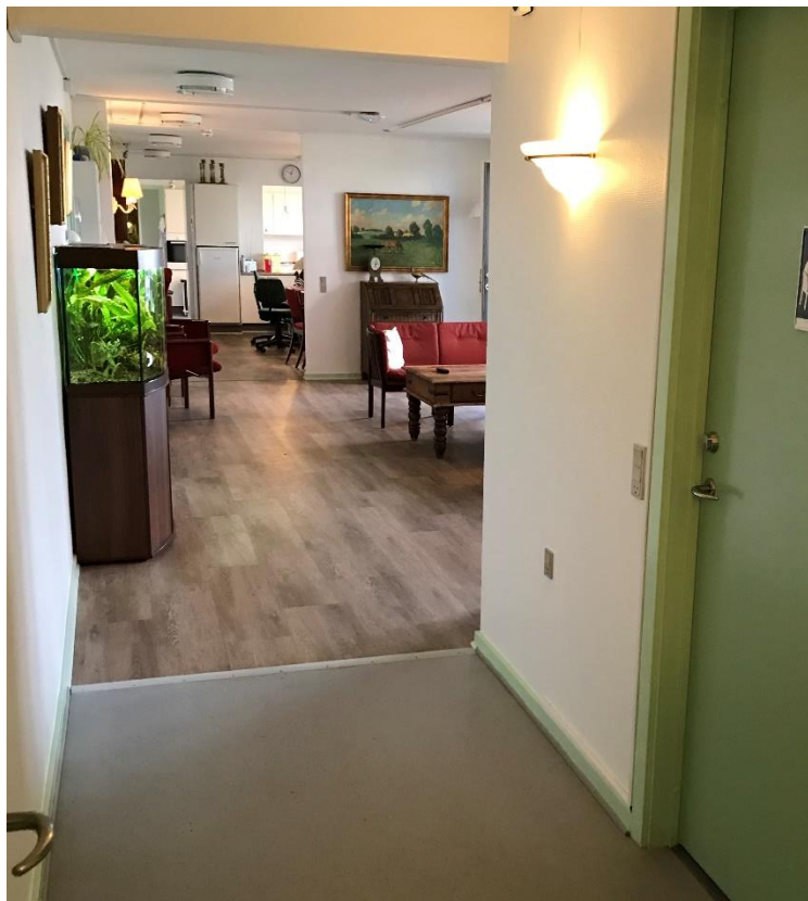
Figur 2: Manglende fribredde på 2.4 m, jf. BR82 pkt. 6.11.4 stk. 2.

Den fri gangbredde til flugtvejsgange er 2,4 m i henhold til BR82. Denne bredde kunne genfindes i byggeriet.