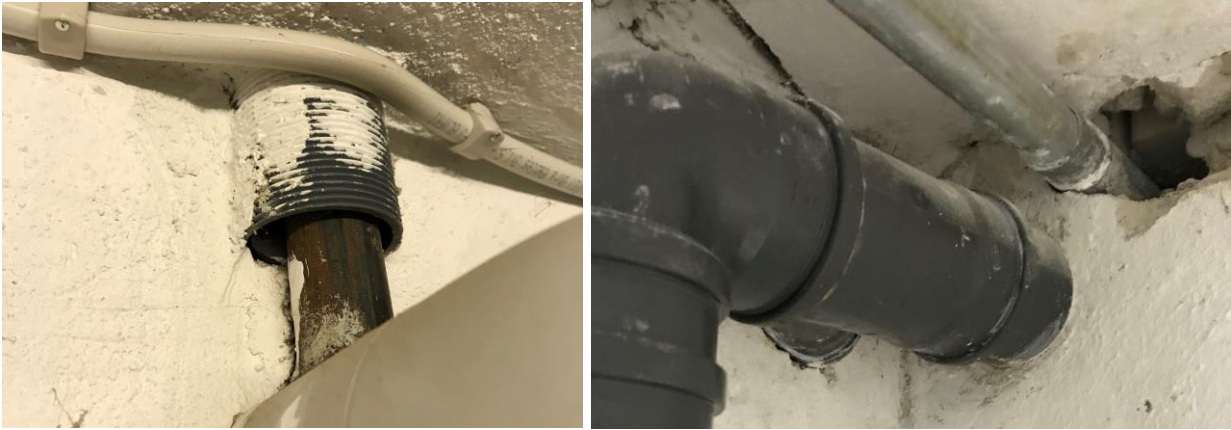
Figur 1: Manglende brandtætning ved installationsgennemføring