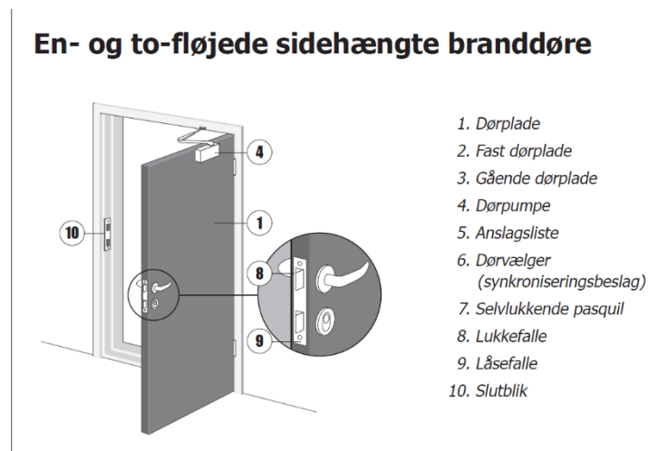
Illustration fra DBI vejledning 26 – Branddøre og brandskydeporte, 1. udgave, juni 1990.

DBI vejledning 26 – Branddøre og brandskydeporte. Branddøre skal udføres med låsekasse med lukkefalle og låsefalle. Se illustrationen herunder.