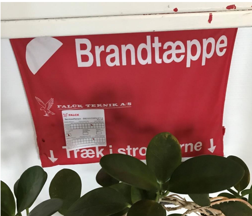
Figur 7: Brandtæppe er ikke frit tilgængeligt